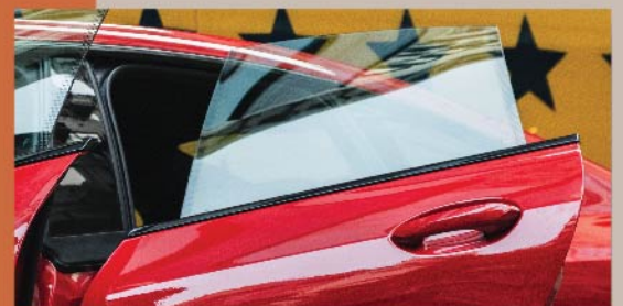
富動感的無窗框車窗設計