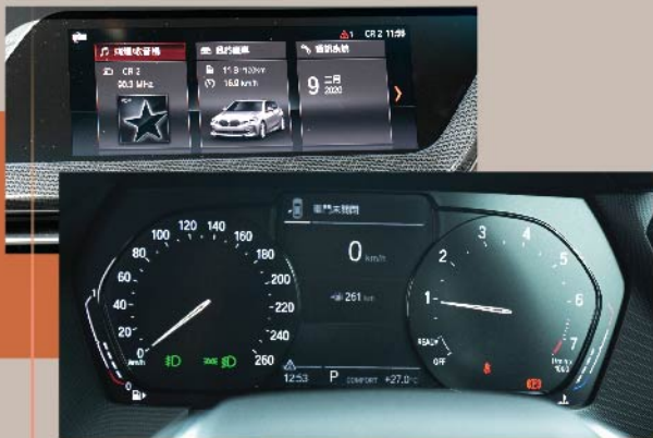
中控台採用8.8吋觸控式螢幕 連5.1吋全彩色Black Panel儀表板