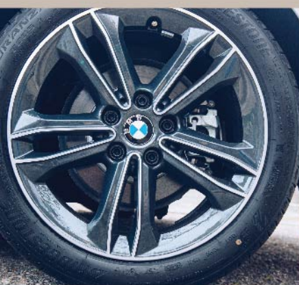
採用ARB技術提升濕地及 過彎抓地力，比起傳統DSC 動態穩定控制系統快上3倍， 操控更靈活