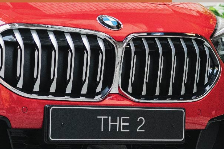
一體化的雙腎形鬼面罩設計