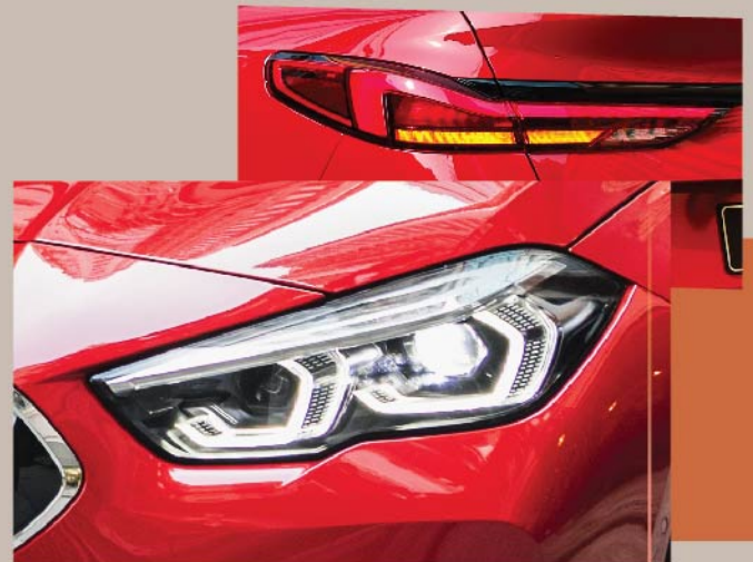
新一代六角形LED頭燈及 L型LED尾燈