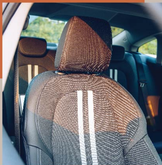
Sensatec皮質/織布混合式 運動型座椅