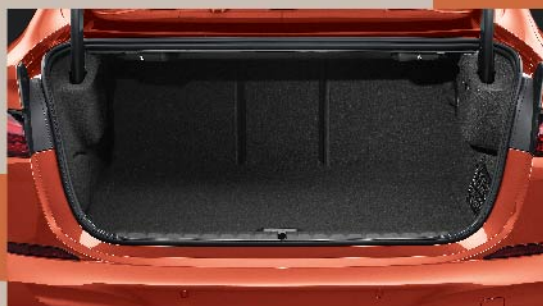
行李箱空間達430公升